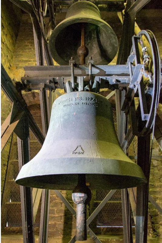
Zwei der drei Glocken in der heutigen Friedenskirche, 1962 Inscript: „Psalm 119, 165 – Martin Luther“ (Das Foto in besserer Auflösung findet sich >>hier. )

Schon im selben Jahr wurde er Mitglied des Rates der neugegründeten „Evangelische Kirche in Deutschland“ (EKD), zwei Jahre später dann Kirchenpräsident der Evangelische Kirche in Hessen und Nassau (bis 1964). Sein unermüdliches Engagement galt vor allem der Friedensarbeit: u. a. gegen die Wiederbewaffnung der jungen Bundesrepublik, später für Abrüstung und gegen die Stationierung amerikanischer Atomwaffen in Europa.